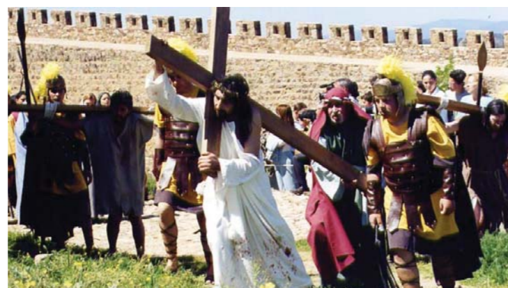
Pasión viviente.