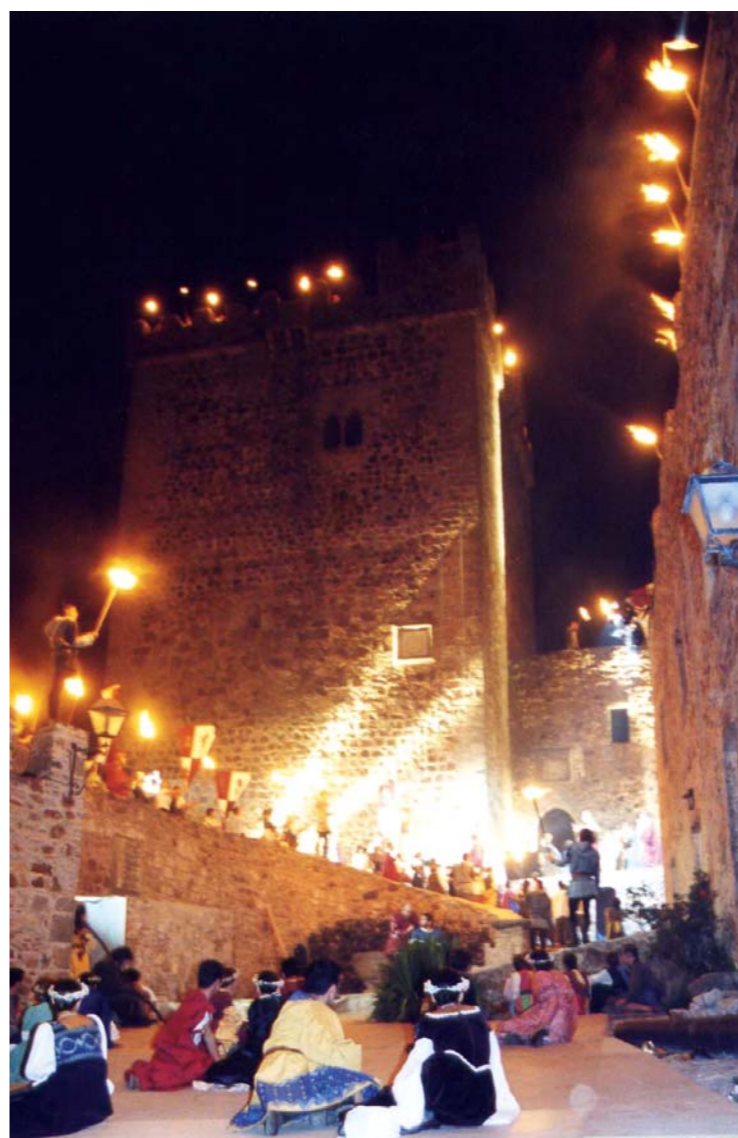
Festival Medieval.