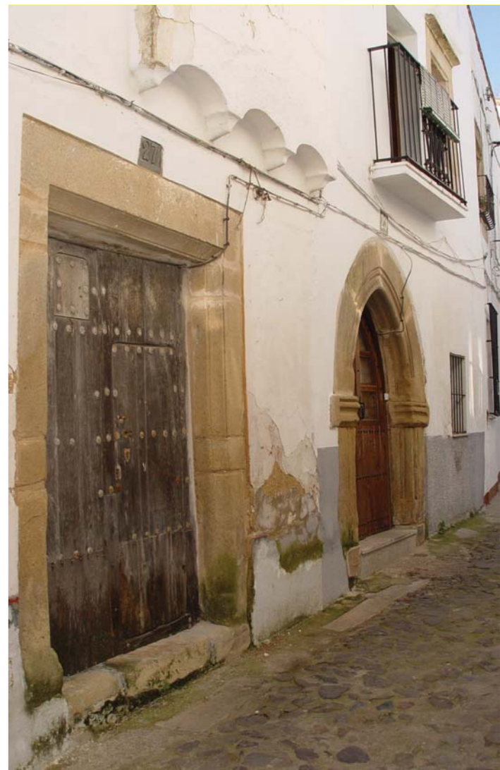
Barrio Gótico-Judío.