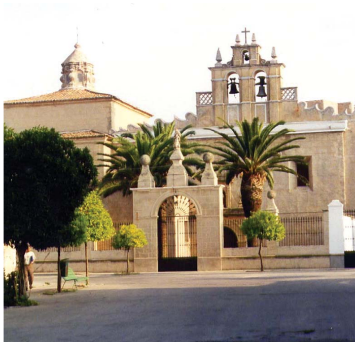
Iglesia de San Francisco.