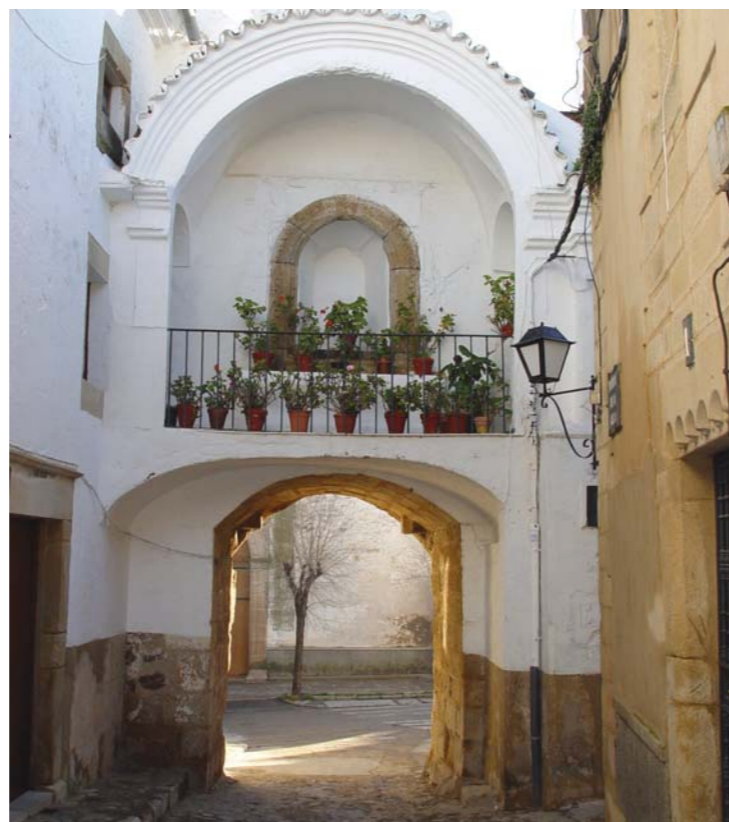
Puerta de la Villa. / Foto: F. J. NEGRETE